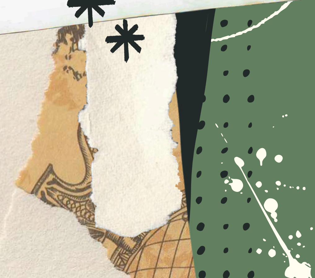
Dessins et photos de Louis Matray, issus du spectacle "J'ai traversé l'Arbre sans fin" d'après Claude Ponti